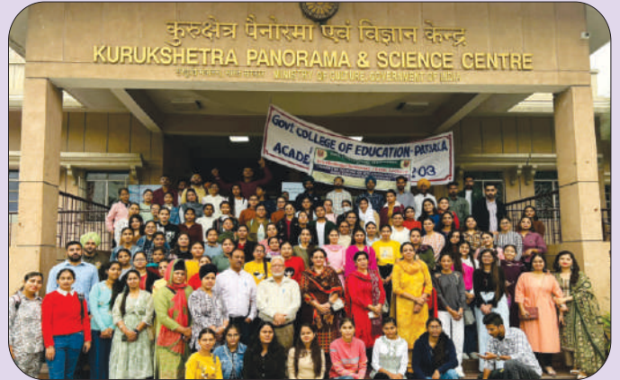
ਮਿਤੀ 10-11-2024 ਨੂੰ ਵੇਕੇਸ਼ਨਲਾਈਜ਼ੇਸ਼ਨ ਅਤੇ ਸਕਿਲ ਡਿਵੈਲਪਮੇਂਟ ਸਕੀਮ ਪੰਜਾਬ ਸਰਕਾਰ ਤਹਿਤ ਆਯੋਜਿਤ ਵਿਦਿਅਕ ਟੂਰ ਦੌਰਾਨ ਵਿਦਿਆਰਥੀ ਅਤੇ ਇੰਚਾਰਜ ਕਲਪਨਾ ਚਾਵਲਾ ਤਾਰਾ ਮੰਡਲ, ਕੁਰੂਕਸ਼ੇਤਰ ਵਿਖੇ