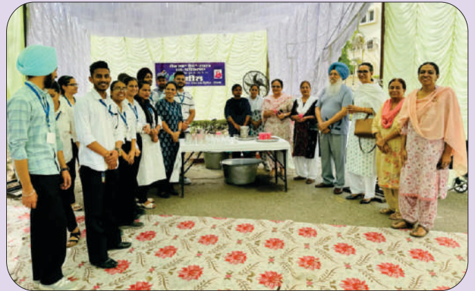
ਮਿਤੀ 01-06-2024 ਨੂੰ ਲੋਕ ਸਭਾ ਚੋਣਾਂ ਦੌਰਾਨ ਕਾਲਜ ਵਿੱਚ ਮਤਦਾਤਾਵਾਂ ਲਈ ਛਬੀਲ ਲਗਾਉਂਦੇ ਹੋਏ ਪ੍ਰਿੰਸੀਪਲ, ਸਟਾਫ ਅਤੇ ਵਿਦਿਆਰਥੀ