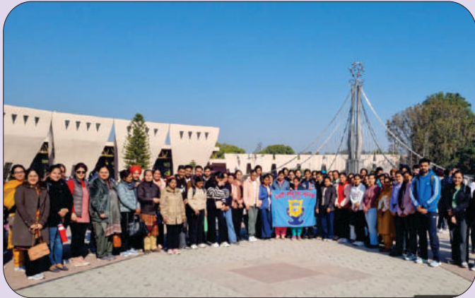
ਮਿਤੀ 8-02-2024 ਨੂੰ ਕਰੀਅਰ ਕਾਊਂਸਲਿੰਗ ਸਕੀਮ ਪੰਜਾਬ ਸਰਕਾਰ ਤਹਿਤ ਆਯੋਜਿਤ ਵਿਦਿਅਕ ਟੂਰ ਦੌਰਾਨ ਵਿਦਿਆਰਥੀ ਅਤੇ ਇੰਚਾਰਜ ਸਾਇੰਸ ਸਿਟੀ ਕਪੂਰਥਲਾ ਵਿਖੇ