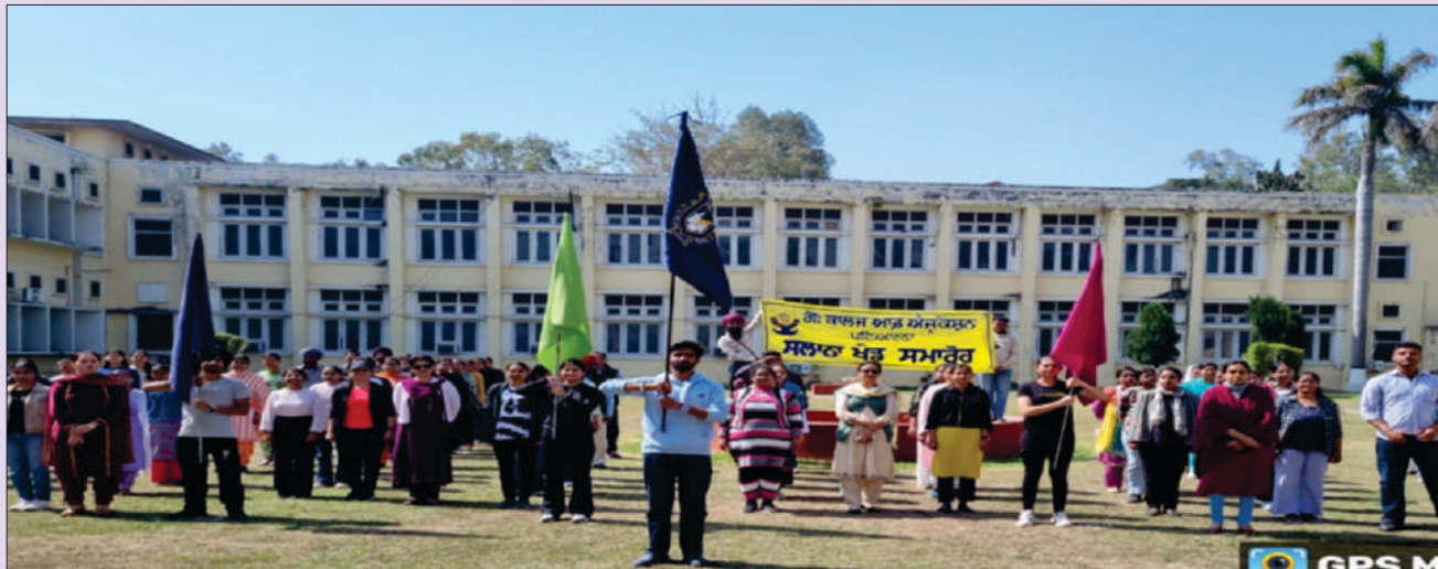
ਮਿਤੀ 18-03-2024 ਨੂੰ ਸਲਾਨਾ ਖੇਡ ਸਮਾਰੋਹ ਦੀ ਪਰੇਡ ਵਿੱਚ ਸ਼ਾਮਿਲ ਵਿਦਿਆਰਥੀ