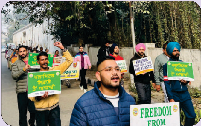
ਬੀਟ ਦ ਪਲਾਸਟਿਕ ਪ੍ਰਦੂਸ਼ਨ ਚੇਤਨਾ ਰੈਲੀ ਦੌਰਾਨ ਸੱਤ ਰੋਜ਼ਾ ਐਨ.ਐਸ.ਐਸ. ਕੈਂਪ (23 ਤੋਂ 30 ਦਸੰਬਰ 2023) ਦੇ ਵਲੰਟੀਅਰ