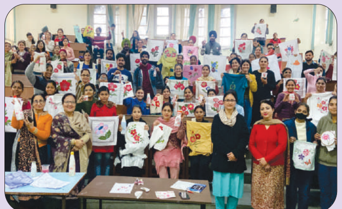
ਮਿਤੀ 30 ਅਤੇ 31 ਜਨਵਰੀ 2024 ਨੂੰ ਵੇਕੇਸ਼ਨਲਾਈਜ਼ੇਸ਼ਨ ਅਤੇ ਸਕਿਲ ਡਿਵੈਲਪਮੇਂਟ ਸਕੀਮ ਪੰਜਾਬ ਸਰਕਾਰ ਤਹਿਤ ਆਯੋਜਿਤ ਦੋ ਦਿਨਾਂ ਵਰਕਸ਼ਾਪ Artsy Hive ਵਿੱਚ ਸ਼ਾਮਿਲ ਵਿਦਿਆਰਥੀ ਅਤੇ ਸਟਾਫ