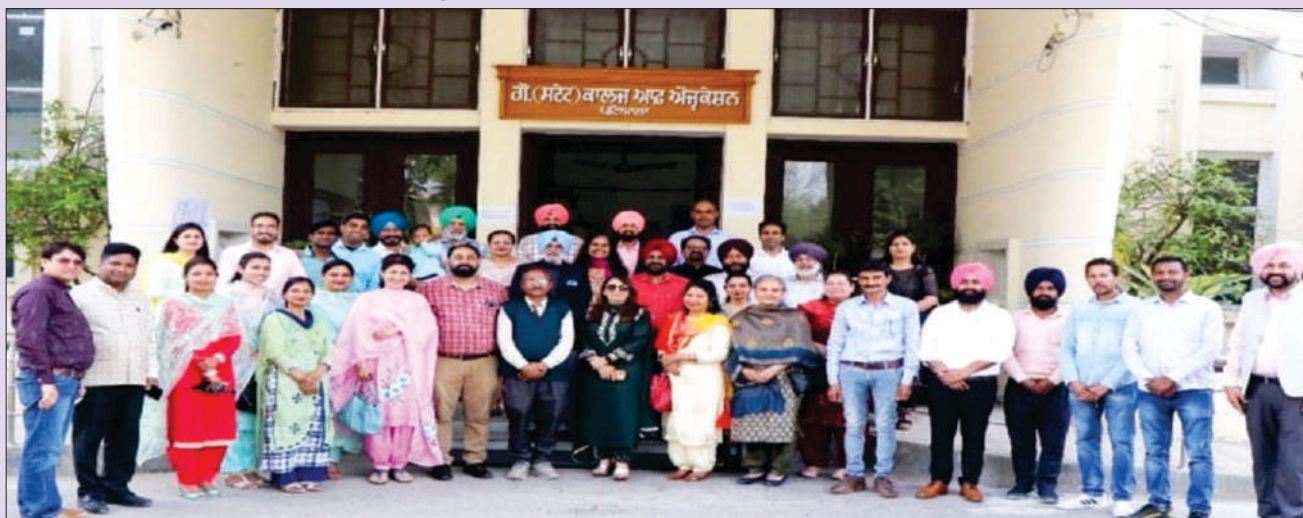
ਮਿਤੀ 27-01-2024 ਨੂੰ ਓਲਡ ਸਟੂਡੈਂਟ ਅਸੋਸੀਏਸ਼ਨ ਦੀ ਮਿਲਣੀ ਵਿੱਚ ਸ਼ਾਮਿਲ ਪੁਰਾਣੇ ਵਿਦਿਆਰਥੀ