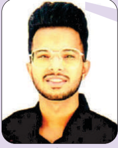
ਮੰਥਨ (ਬੀ.ਐਡ. ਭਾਗ-1) ਅੰਤਰ ਖੇਤਰੀ ਯੁਵਕ ਮੇਲਾ 2023 ਵਿੱਚ ਲੋਕ ਗੀਤ ਪਹਿਲਾ ਸਥਾਨ ਅਤੇ ਖੇਤਰੀ ਯੁਵਕ ਮੇਲਾ 2023 ਵਿੱਚ ਦੂਸਰਾ ਸਥਾਨ