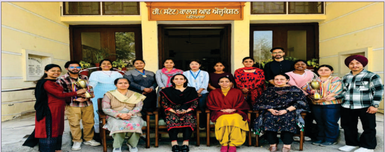
ਯੂਥ ਫੈਸਟੀਵਲ 2023 ਦੇ ਜੇਤੂ ਵਿਦਿਆਰਥੀ, ਪ੍ਰਿੰਸੀਪਲ ਅਤੇ ਇੰਚਾਰਜ ਅਧਿਆਪਕ ਸਾਹਿਬਾਨ