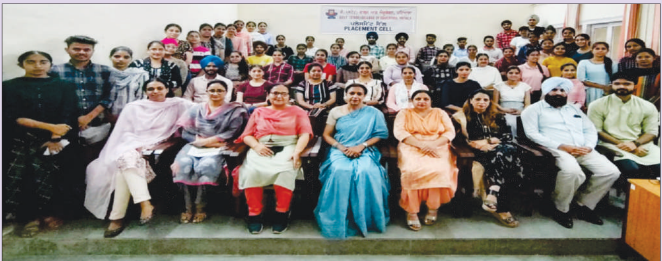
ਕਾਲਜ ਦੇ ਪੰਜਾਬ ਸਟੇਟ ਟੀਚਰ ਇਲੀਜੀਬਿਲਟੀ ਟੈਸਟ (PSTET) ਪਾਸ ਵਿਦਿਆਰਥੀ, ਪ੍ਰਿੰਸੀਪਲ ਅਤੇ ਸਮੂਹ ਸਟਾਫ