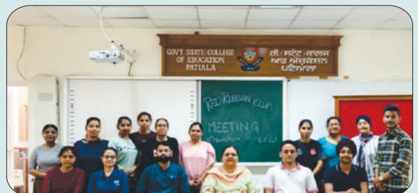
ਮਿਤੀ 30 ਮਾਰਚ 2024 ਨੂੰ ਰੈਡ ਰੀਬਨ ਕਲੱਬ ਮੈਂਬਰ ਮੀਟਿੰਗ ਕਰਦੇ ਹੋਏ