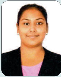
ਅਰਚਿਤਾ ਬੀ.ਐਡ. ਭਾਗ-11 ਕਾਲਜ ਕਲਰ ਫੋਕ ਆਰਟ