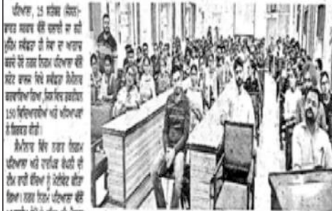
ਨਗਰ ਨਿਗਮ ਦੀ ਸਵੈ-ਸੇਵਾ ਸਮੇਂਗਰ ਦਾ ਉਦਘਾਟਨ।

ਪਟਿਆਲਾ, 15 ਜਨਵਰੀ (ਗੁਰਦਿੱਤ ਸਿੰਘ ਐੱਸ.ਐੱਸ.)—ਨਗਰ ਨਿਗਮ ਪਟਿਆਲਾ ਨੇ ਸਟੇਟ ਕਾਲਜ ਵਿਖੇ ਸਵੈ-ਸੇਵਾ ਸਮੇਂਗਰ ਦਾ ਉਦਘਾਟਨ ਕਰਵਾਇਆ। ਇਸ ਸਮੇਂਗਰ ਵਿਖੇ ਨਗਰ ਨਿਗਮ ਦੇ ਮੈਂਬਰਾਂ ਨੇ ਸਟੇਟ ਕਾਲਜ ਵਿਖੇ ਸਵੈ-ਸੇਵਾ ਸਮੇਂਗਰ ਦਾ ਉਦਘਾਟਨ ਕਰਵਾਇਆ। ਇਸ ਸਮੇਂਗਰ ਵਿਖੇ ਨਗਰ ਨਿਗਮ ਦੇ ਮੈਂਬਰਾਂ ਨੇ ਸਟੇਟ ਕਾਲਜ ਵਿਖੇ ਸਵੈ-ਸੇਵਾ ਸਮੇਂਗਰ ਦਾ ਉਦਘਾਟਨ ਕਰਵਾਇਆ।