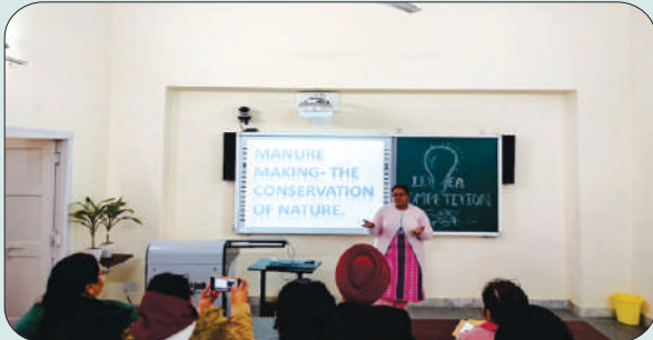
ਮਿਤੀ 29 ਜਨਵਰੀ 2024 ਨੂੰ ਇੰਟਰਾ ਇੰਸਟੀਟਿਊਸ਼ਨਲ ਆਈਡੀਆ ਕੰਪੀਟੀਸ਼ਨ ਵਿਚ ਆਈਡੀਆ ਪੇਸ਼ ਕਰਦੀ ਹੋਈ ਵਿਦਿਆਰਥਣ