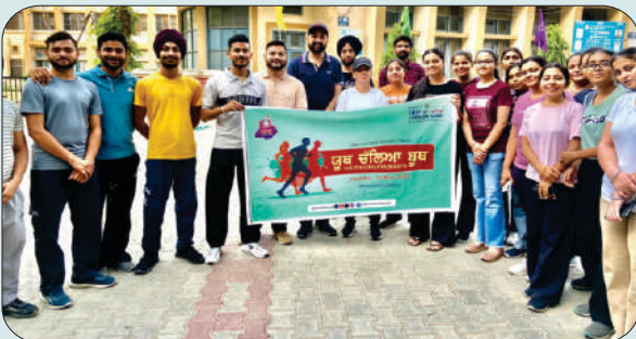
ਮਿਤੀ 30 ਮਈ 2024 ਨੂੰ ਜ਼ਿਲ੍ਹਾ ਪ੍ਰਸ਼ਾਸਨ ਵੱਲੋਂ ਕਰਵਾਈ 'ਯੂਥ ਚੱਲਿਆ ਬੁਥ' ਮੁਹਿੰਮ ਵਿੱਚ ਭਾਗ ਲੈਂਦੇ ਹੋਏ ਵਿਦਿਆਰਥੀ