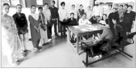
ਸਟੇਟ ਕਾਲਜ ਆਫ਼ ਐਜੂਕੇਸ਼ਨ ਵਿਖੇ ਲਗਾਏ ਕੈਂਪ ਦਾ ਦ੍ਰਿਸ਼। ਅਜੀਰ ਤਕਵੀਰ