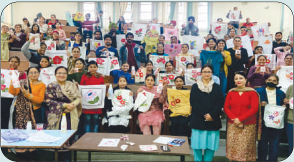
ਮਿਤੀ 9 ਅਤੇ 10 ਫਰਵਰੀ ਨੂੰ ARTSY HIVE ਵਿਸ਼ੇ ਤੇ ਆਯੋਜਿਤ ਦੋ ਰੋਜ਼ਾ ਵਰਕਸ਼ਾਪ ਦੌਰਾਨ ਬਣਾਈਆਂ ਕਲਾਕ੍ਰਿਤੀਆਂ ਦਾ ਪ੍ਰਦਰਸ਼ਨ ਕਰਦੇ ਹੋਏ ਵਿਦਿਆਰਥੀ