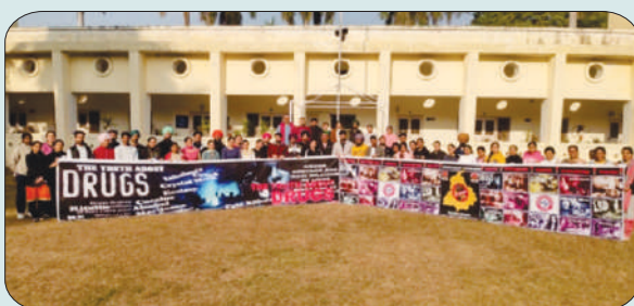
ਮਿਤੀ 29 ਦਸੰਬਰ 2023 ਨੂੰ 'ਨਸ਼ੇ ਨੂੰ ਨਾਂਹ ਜੀਵਨ ਨੂੰ ਹਾਂ' ਜਾਗਰੂਕਤਾ ਰੈਲੀ ਕਢਦੇ ਹੋਏ ਵਿਦਿਆਰਥੀ