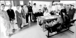
ਸਟੇਟ ਕਾਲਜ ਆਫ ਐਮੂਕੇਸ਼ਨ ਵਿਖੇ ਲਗਾਏ ਗਏ ਪ੍ਰੋਗਰਾਮ ਦਾ ਸਿਖਾ। ਅਖੀਰ ਸਮਾਗਮ

ਸਟੇਟ ਕਾਲਜ ਵਿਖੇ ਵਿਸ਼ੇਸ਼ ਸਰਸਰੀ ਸੁਧਾਈ 2024 ਮੁਹਿੰਮ ਤਹਿਤ ਕੈਂਪ ਲਗਾਇਆ ਪਟਿਆਲਾ, 4 ਨਵੰਬਰ (ਗੁਰਬਿੰਦ ਸਿੰਘ ਚੌਹਾਣ) - ਸਟੇਟ ਕਾਲਜ ਆਫ ਐਮੂਕੇਸ਼ਨ ਵਿਖੇ ਲਗਾਏ ਗਏ ਪ੍ਰੋਗਰਾਮ ਦਾ ਸਿਖਾ ਅਖੀਰ ਸਮਾਗਮ ਹੋਇਆ। ਇਸ ਮੌਕੇ ਸਟੇਟ ਕਾਲਜ ਆਫ ਐਮੂਕੇਸ਼ਨ ਵਿਖੇ ਲਗਾਏ ਗਏ ਪ੍ਰੋਗਰਾਮ ਦਾ ਸਿਖਾ ਅਖੀਰ ਸਮਾਗਮ ਹੋਇਆ। ਇਸ ਮੌਕੇ ਸਟੇਟ ਕਾਲਜ ਆਫ ਐਮੂਕੇਸ਼ਨ ਵਿਖੇ ਲਗਾਏ ਗਏ ਪ੍ਰੋਗਰਾਮ ਦਾ ਸਿਖਾ ਅਖੀਰ ਸਮਾਗਮ ਹੋਇਆ।