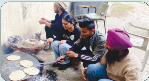
ਮਿਤੀ 28 ਦਸੰਬਰ 2023 ਨੂੰ ਐਨ.ਐਸ.ਐਸ. ਕੈਂਪ ਦੌਰਾਨ ਖਾਣਾ ਤਿਆਰ ਕਰਦੇ ਹੋਏ ਵਲੰਟੀਅਰ