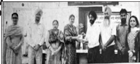
ਸਰਕਾਰੀ ਕਾਲਜ ਆਫ਼ ਐਜੂਕੇਸ਼ਨ ਵਿਖੇ ਕਰਵਾਏ ਵਿਦਿਆਰਥੀ ਸਮਾਜਿਕ ਪ੍ਰੋਗਰਾਮ ਦਾ ਉਦਘਾਟਨ।