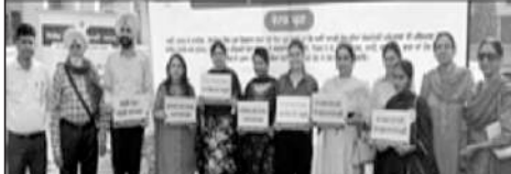
ਯੁਵਕ ਮੇਲੇ ਦੌਰਾਨ ਵੋਟਰ ਸਾਗਰੂਕਤਾ ਦਾ ਦਿੱਤਾ ਸੁਨੇਹਾ।

ਪਟਿਆਲਾ, 10 ਨਵੰਬਰ (ਗੁਰਦਿੱਤ ਸਿੰਘ ਐੱਸ.ਐੱਸ.)—ਯੁਵਕ ਮੇਲੇ ਦੌਰਾਨ ਵੋਟਰ ਸਾਗਰੂਕਤਾ ਦਾ ਦਿੱਤਾ ਸੁਨੇਹਾ। ਇਸ ਮੇਲੇ ਵਿੱਚ ਯੁਵਕਾਂ ਨੂੰ ਵੋਟਰ ਸਾਗਰੂਕਤਾ ਦੀ ਮਹੱਤਤਾ ਬਾਰੇ ਸੂਚੀਤ ਕੀਤਾ ਗਿਆ। ਇਸ ਤੋਂ ਇਲਾਵਾ, ਸਮਾਜਿਕ ਪ੍ਰੋਗਰਾਮਾਂ ਦੀ ਮਹੱਤਤਾ ਬਾਰੇ ਸੂਚੀਤ ਕੀਤਾ ਗਿਆ।