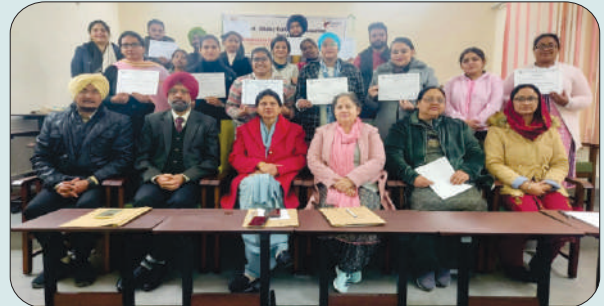
ਮਿਤੀ 29 ਜਨਵਰੀ 2024 ਨੂੰ ਇੰਟਰਾ ਇੰਸਟੀਟਿਊਸ਼ਨਲ ਆਈਡੀਆ ਕੰਪੀਟੀਸ਼ਨ ਵਿਚ ਭਾਗ ਲੈਣ ਵਾਲੇ ਵਿਦਿਆਰਥੀ, ਮੁੱਖ ਮਹਿਮਾਨ, ਪ੍ਰਿੰਸੀਪਲ ਅਤੇ ਫੈਕਲਟੀ ਮੈਂਬਰ