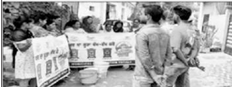
ਪਟਿਆਲਾ, 25 ਸਤੰਬਰ (ਗੁਪਤਾ) : ਨਗਰ ਨਿਗਮ ਵੱਲੋਂ ਵੱਖ-ਵੱਖ ਵਾਰਡਾਂ ਵਿੱਚ ਜਾ ਕੇ ਗਿੱਲੇ, ਸੁੱਕੇ ਅਤੇ ਹਾਨੀਕਾਰਕ ਡਰਾਫ਼ ਬਾਰੇ ਡੇਮੋਨਸਟ੍ਰੇਸ਼ਨ ਦਿੱਤੀ ਅਤੇ ਘਰ ਦੇ ਕੂੜੇ ਨੂੰ ਤਿੰਨ ਭਾਗਾਂ ਵਿੱਚ ਵੰਡਣ ਦੀ ਅਪੀਲ ਕੀਤੀ ਤਾਂ ਜੋ ਕੂੜੇ ਦਾ ਨਿਰਾਣਾਫ ਵਿਗਿਆਨਕ ਢੰਗ ਨਾਲ ਕੀਤਾ ਜਾ ਸਕੇ। ਨਗਰ ਨਿਗਮ ਪਟਿਆਲਾ ਅਮਨਦੀਪ ਸਬੰਧੀ ਆਈ ਟੀ ਸੀ ਐਕਸਪਰਟ ਨੇ ਦੱਸਿਆ ਕਿ ਡੇਗੂ ਖ਼ਿਲਾਫ਼ੀ ਦੇ ਸੰਪੂਰਨ ਖਾਤਮੇ ਲਈ ਨਗਰ ਨਿਗਮ ਪਟਿਆਲਾ ਕਮਿਸ਼ਨਰੀ ਆਦਿਤਿਕਾ ਉਪਲਬਧ ਨਿਗਰਾਨੀ ਹੇਠ ਸੈਨੇਟਰੀ ਇੰਸਪੈਕਟਰ ਦੀਆਂ ਵੱਖ-ਵੱਖ ਟੀਮਾਂ ਨੇ ਗ਼ਰਿਹ ਚੜ੍ਹਦੀ ਗਈ ਅਤੇ ਲੋਕਾਂ ਨੂੰ ਆਪਣੇ ਘਰ ਅਤੇ ਦੁਕਾਨਾਂ ਵਿੱਚ ਪਾਣੀ ਖਰੂ ਨਾ ਰੁੱਠਣ ਦੀ ਬੇਨਤੀ ਕੀਤੀ ਗਈ ਤਾਂ ਜੋ ਉਸ ਵਿੱਚ ਡੇਗੂ ਮਿੱਢਰ ਦੇ ਲਾਰਵਾ ਨਾ ਪੈਦਾ ਹੋ ਸਕੇ।

ਕਰੰਜ ਮੁਕਤੀ, ਮਨੋਰੰਗਾ ਤਹਿਤ ਸਾਲ ਸ਼ਬਕ ਮਾਰਗਾਂ ਲਈ ਐਕਵਾਇਰ ਦੇ 200 ਟਿਨ ਤੁਸ਼ਰਾਹ, ਪੰਜਾਬ ਸਮੇਤ ਸ਼ਮੀਨਾ ਦੇ ਹੇਟ 6 ਗੁਣਾ ਵਾਧਾ ਕਰਕੇ ਗਿੱਲੇ-ਸੁੱਕੇ ਨੂੰ ਤਿੰਨ ਭਾਗਾਂ 'ਚ ਵੰਡਣ ਅਤੇ ਡੇਗੂ ਦੇ ਖਾਤਮੇ ਸਬੰਧੀ ਦਿੱਤੀ ਜਾਣਕਾਰੀ