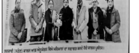
ਸਟੇਟ ਕਾਲੇਜ ਵਿਖੇ ਆਯੋਜਿਤ ਵਰਕਸ਼ਾਪ ਦਾ ਉਦਘਾਟਨ।

ਪਟਿਆਲਾ, 14 ਨਵੰਬਰ (ਗੁਰਦਿੱਤ ਸਿੰਘ ਐੱਸ.ਐੱਸ.)—ਸਟੇਟ ਕਾਲੇਜ ਆਫ਼ ਐਜੂਕੇਸ਼ਨ ਵਿਖੇ ਇੱਕ ਵਰਕਸ਼ਾਪ ਕਰਵਾਈ ਗਈ। ਇਸ ਵਰਕਸ਼ਾਪ ਵਿੱਚ ਵਿਦਿਆਰਥੀਆਂ ਨੂੰ ਸ਼ੈਖ਼ਣਿਕ ਪ੍ਰੋਗਰਾਮਾਂ ਦੀ ਮਹੱਤਤਾ ਬਾਰੇ ਸੂਚੀਤ ਕੀਤਾ ਗਿਆ। ਇਸ ਤੋਂ ਇਲਾਵਾ, ਸਮਾਜਿਕ ਪ੍ਰੋਗਰਾਮਾਂ ਦੀ ਮਹੱਤਤਾ ਬਾਰੇ ਸੂਚੀਤ ਕੀਤਾ ਗਿਆ।