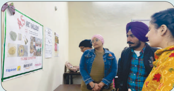
ਮਿਤੀ 2 ਫਰਵਰੀ 2024 ਨੂੰ ਆਈਡੀਆ ਪ੍ਰਦਰਸ਼ਨੀ ਕਮ ਮੈਂਟਰਸ਼ਿਪ ਵਿਚ ਆਈਡੀਆ ਪ੍ਰਦਰਸ਼ਨ ਕਰਦੇ ਹੋਏ ਵਿਦਿਆਰਥੀ