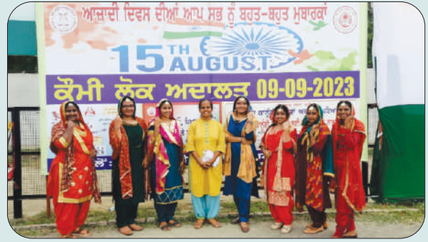
ਮਿਤੀ 15 ਅਗਸਤ 2023 ਨੂੰ ਸੁਤੰਤਰਤਾ ਦਿਵਸ ਮੌਕੇ ਜ਼ਿਲ੍ਹਾ ਪੱਧਰੀ ਪ੍ਰੋਗਰਾਮ ਵਿੱਚ ਗਿੱਧੇ ਦੀ ਪੇਸ਼ਕਾਰੀ ਕਰਨ ਵਾਲੀਆਂ ਕਾਲਜ ਦੀਆਂ ਵਿਦਿਆਰਥਣਾਂ ਅਤੇ ਇੰਚਾਰਜ