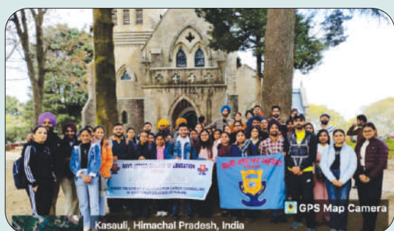
ਮਿਤੀ 30 ਦਸੰਬਰ 2023 ਨੂੰ ਕਰੀਅਰ ਕਾਉਂਸਲਿੰਗ ਸਕੀਮ ਤਹਿਤ ਕਸੌਲੀ ਵਿਖੇ ਵਿੱਦਿਅਕ ਟੂਰ ਦੌਰਾਨ ਵਿਦਿਆਰਥੀ ਅਤੇ ਸਕੀਮ ਇੰਚਾਰਜ