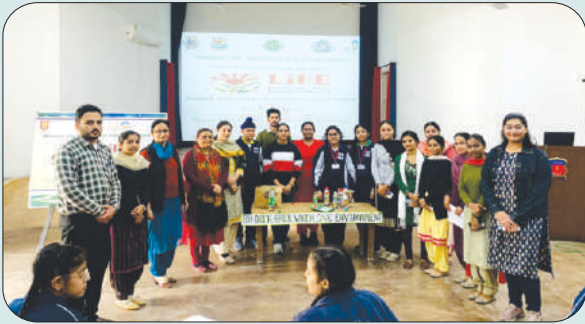
ਮਿਤੀ 1 ਦਸੰਬਰ 2023 ਨੂੰ ਮਾਡਰਨ ਸਕੂਲ ਵਿਖੇ ਕਾਲਜ ਦੇ ਵਿਦਿਆਰਥੀ-ਅਧਿਆਪਕ 'ਈਕੋ ਬਰਿਕ' ਵਰਕਸ਼ਾਪ ਦਾ ਆਯੋਜਨ ਕਰਦੇ ਹੋਏ