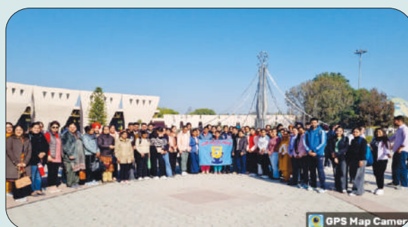
ਮਿਤੀ 8 ਫਰਵਰੀ 2024 ਨੂੰ ਕਰੀਅਰ ਕਾਉਂਸਲਿੰਗ ਸਕੀਮ ਤਹਿਤ ਸਾਇੰਸ ਸਿਟੀ, ਕਪੂਰਥਲਾ ਦੇ ਵਿੱਦਿਅਕ ਦੌਰੇ ਤੇ ਵਿਦਿਆਰਥੀ ਅਤੇ ਸਕੀਮ ਇੰਚਾਰਜ