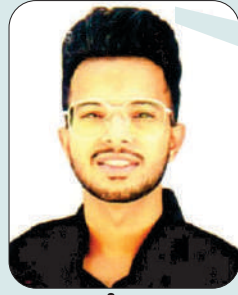
ਮੰਬਨ ਬੀ.ਐਡ. ਭਾਗ-1 ਰੋਲ ਆਫ਼ ਆਨਰ ਸੰਗੀਤ