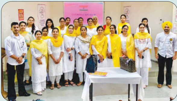
ਮਿਤੀ 10 ਅਕਤੂਬਰ 2023 ਨੂੰ ਬੀ.ਐਡ.1 ਦੇ ਵਿਦਿਆਰਥੀ 'ਨੈਵਰ ਸਟਾਪ ਲਰਨਿੰਗ' ਥੀਮ ਤੇ ਸਵੇਰ ਦੀ ਸਭਾ ਦਾ ਆਯੋਜਨ ਕਰਦੇ ਹੋਏ