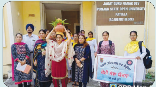
ਮਿਤੀ 10 ਅਕਤੂਬਰ 2023 ਨੂੰ 'ਮੇਰੀ ਮਾਟੀ ਮੇਰਾ ਦੇਸ਼' ਮੁਹਿੰਮ ਤਹਿਤ ਕਲਾਸ ਯਾਤਰਾ ਕਵਚਦੇ ਹੋਏ ਕਾਲਜ ਪ੍ਰਿੰਸੀਪਲ, ਫੈਕਲਟੀ ਮੈਂਬਰ ਅਤੇ ਵਿਦਿਆਰਥੀ