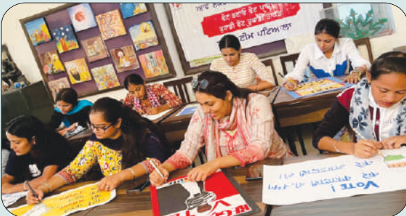
ਮਿਤੀ 4 ਅਪ੍ਰੈਲ 2024 ਨੂੰ 'ਮੇਰਾ ਪਹਿਲਾ ਵੋਟ ਦੇਸ਼ ਕੇ ਲਿਯੇ' ਵਿਸ਼ੇ ਤੇ ਪੋਸਟਰ ਮੇਕਿੰਗ ਮੁਕਾਬਲੇ ਵਿੱਚ ਭਾਗ ਲੈਂਦੇ ਵਿਦਿਆਰਥੀ