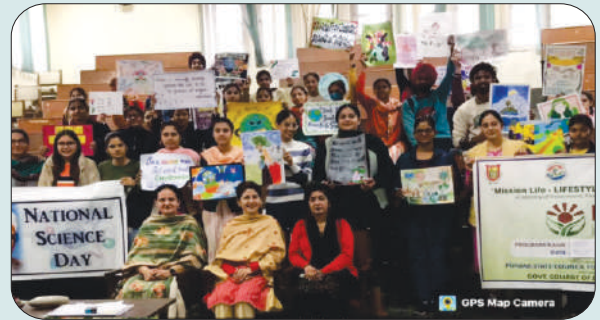
ਮਿਤੀ 28 ਫਰਵਰੀ 2024 ਨੂੰ ਰਾਸ਼ਟਰੀ ਵਿਗਿਆਨ ਦਿਵਸ ਦੇ ਮੌਕੇ ਤੇ ਅਧਿਆਪਕ ਅਤੇ ਵਿਦਿਆਰਥੀ ਪੋਸਟਰਾਂ ਨਾਲ