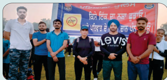
ਮਿਤੀ 14 ਅਕਤੂਬਰ 2023 ਨੂੰ ਜ਼ਿਲ੍ਹਾ ਪ੍ਰਸ਼ਾਸਨ ਵੱਲੋਂ ਪੋਲੋ ਗ੍ਰਾਊਂਡ ਪਟਿਆਲਾ ਵਿਖੇ ਕਰਵਾਈ ਨਸ਼ਿਆਂ ਵਿਰੁੱਧ ਮੁਹਿੰਮ ਵਿੱਚ ਭਾਗ ਲੈਂਦੇ ਹੋਏ ਕਾਲਜ ਵਿਦਿਆਰਥੀ ਅਤੇ ਇੰਚਾਰਜ