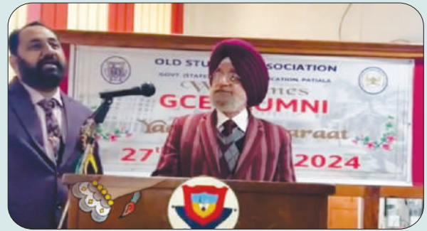
ਮਿਤੀ 27 ਜਨਵਰੀ 2024 ਨੂੰ ਸਲਾਨਾ ਅਲੂਮਨੀ ਮੀਟ ਵਿੱਚ ਯਾਦਾਂ ਸਾਂਝੀਆਂ ਕਰਦੇ ਹੋਏ ਪੁਰਾਣੇ ਵਿਦਿਆਰਥੀ