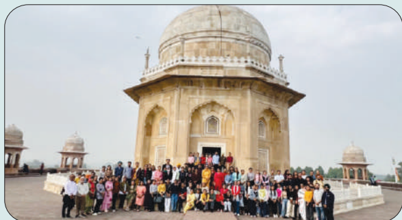
ਮਿਤੀ 10 ਨਵੰਬਰ 2023 ਨੂੰ ਵੇਕੋਸ਼ਨਲਾਈਜ਼ੇਸ਼ਨ ਸਕੀਮ ਤਹਿਤ ਕੁਰੂਕਸ਼ੇਤਰ ਵਿਖੇ ਵਿੱਦਿਅਕ ਟੂਰ ਦੌਰਾਨ ਵਿਦਿਆਰਥੀ ਅਤੇ ਸਕੀਮ ਇੰਚਾਰਜ