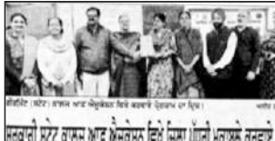
ਸਰਕਾਰੀ ਸਟੇਟ ਕਾਲਜ ਆਫ ਐਮੂਕੇਸ਼ਨ ਵਿਖੇ ਸਿੱਖ ਪੱਧਰੀ ਮੁਕਾਬਲੇ ਕਰਵਾਏ ਗਏ

ਸਟੇਟ ਕਾਲਜ ਵਿਖੇ ਵਿਸ਼ੇਸ਼ ਸਰਸਰੀ ਸੁਧਾਈ 2024 ਮੁਹਿੰਮ ਤਹਿਤ ਕੈਂਪ ਲਗਾਇਆ ਪਟਿਆਲਾ, 4 ਨਵੰਬਰ (ਗੁਰਬਿੰਦ ਸਿੰਘ ਚੌਹਾਣ) - ਸਟੇਟ ਕਾਲਜ ਆਫ ਐਮੂਕੇਸ਼ਨ ਵਿਖੇ ਲਗਾਏ ਗਏ ਪ੍ਰੋਗਰਾਮ ਦਾ ਸਿਖਾ ਅਖੀਰ ਸਮਾਗਮ ਹੋਇਆ। ਇਸ ਮੌਕੇ ਸਟੇਟ ਕਾਲਜ ਆਫ ਐਮੂਕੇਸ਼ਨ ਵਿਖੇ ਲਗਾਏ ਗਏ ਪ੍ਰੋਗਰਾਮ ਦਾ ਸਿਖਾ ਅਖੀਰ ਸਮਾਗਮ ਹੋਇਆ। ਇਸ ਮੌਕੇ ਸਟੇਟ ਕਾਲਜ ਆਫ ਐਮੂਕੇਸ਼ਨ ਵਿਖੇ ਲਗਾਏ ਗਏ ਪ੍ਰੋਗਰਾਮ ਦਾ ਸਿਖਾ ਅਖੀਰ ਸਮਾਗਮ ਹੋਇਆ।