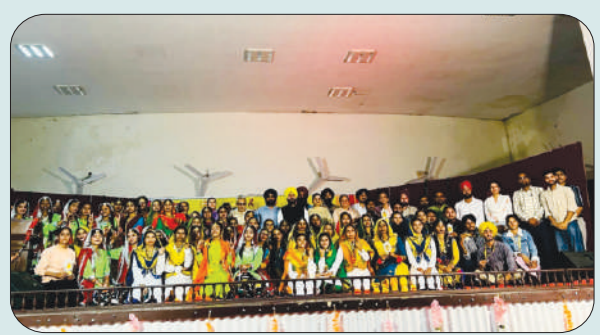
ਮਿਤੀ 8 ਅਤੇ 9 ਨਵੰਬਰ 2023 ਨੂੰ ਜ਼ਿਲ੍ਹਾ ਪੱਧਰੀ ਓਪਨ ਯੁਵਕ ਮੇਲੇ ਵਿੱਚ ਭਾਗ ਲੈਣ ਵਾਲੇ ਵਿਦਿਆਰਥੀਆਂ ਦੀ ਗਰੁੱਪ ਫੋਟੋ