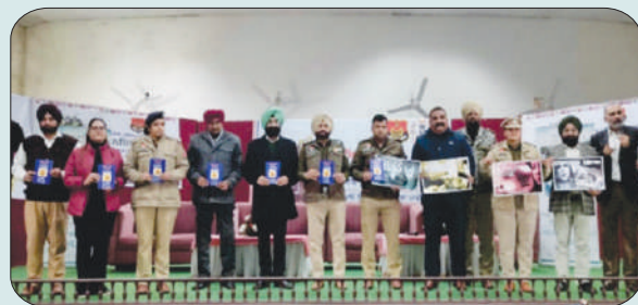
ਮਿਤੀ 30 ਜਨਵਰੀ 2024 ਨੂੰ ਪੰਜਾਬ ਪੁਲਿਸ ਦੇ ਸਹਿਯੋਗ ਨਾਲ ਕਰਵਾਏ ਨਸ਼ਿਆਂ ਵਿਰੁੱਧ ਸੈਮੀਨਾਰ ਵਿੱਚ ਫੈਕਲਟੀ ਮੈਂਬਰ ਅਤੇ ਪੰਜਾਬ ਪੁਲਿਸ