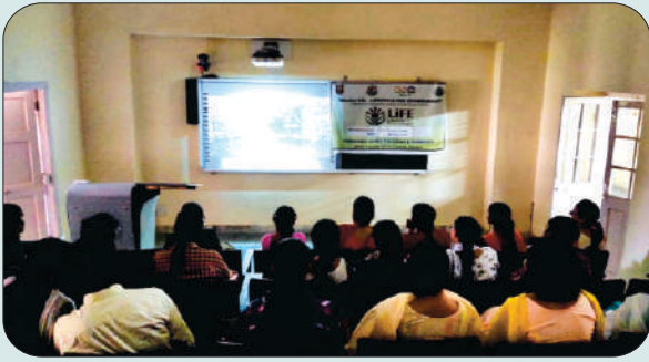
ਮਿਤੀ 5 ਜੂਨ 2023 ਨੂੰ ਵਿਸ਼ਵ ਵਾਤਾਵਰਨ ਦਿਵਸ ਦੇ ਮੌਕੇ ਤੇ ਪਲਾਸਟਿਕ ਚਾਈਨਾ ਫਿਲਮ ਦੇਖਦੇ ਹੋਏ ਵਿਦਿਆਰਥੀ ਅਤੇ ਫੈਕਲਟੀ ਮੈਂਬਰ