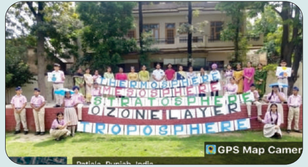
ਮਿਤੀ 16 ਸਤੰਬਰ 2023 ਨੂੰ ਓਜ਼ੋਨ ਦਿਵਸ ਦੇ ਮੌਕੇ ਤੇ ਮਾਡਰਨ ਸਕੂਲ ਵਿਖੇ ਕਾਲਜ ਦੇ ਵਿਦਿਆਰਥੀ-ਅਧਿਆਪਕ ਪਲੇ ਕਾਰਡਾਂ ਨਾਲ