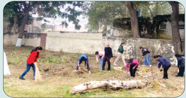
ਮਿਤੀ 26 ਦਸੰਬਰ 2023 ਨੂੰ ਕਾਲਜ ਕੈਂਪਸ ਦੀ ਸਫਾਈ ਕਰਦੇ ਹੋਏ ਐਨ.ਐਸ.ਐਸ. ਵਲੰਟੀਅਰ