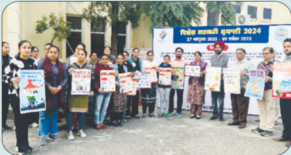
ਮਿਤੀ 29 ਨਵੰਬਰ 2023 ਨੂੰ ਕਾਲਜ ਵਿਖੇ ਬੁਥ ਨੰਬਰ 38 ਅਤੇ 39 ਵਿੱਚ ਵਿਸ਼ੇਸ਼ ਸਰਸਰੀ ਸੁਧਾਈ ਦੌਰਾਨ ਵਿਦਿਆਰਥੀ