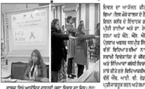
ਗੌਰਮਿੰਟ ਕਾਲਜ ਆਫ਼ ਐਜੂਕੇਸ਼ਨ ਵਿਖੇ ਗਾਇਰੀ ਯੁਵਾ ਦਿਵਸ ਦਾ ਉਦਘਾਟਨ।

ਪਟਿਆਲਾ, 16 ਜਨਵਰੀ (ਗੁਰਦਿੱਤ ਸਿੰਘ ਐੱਸ.ਐੱਸ.)—ਗੌਰਮਿੰਟ ਕਾਲਜ ਆਫ਼ ਐਜੂਕੇਸ਼ਨ ਵਿਖੇ ਗਾਇਰੀ ਯੁਵਾ ਦਿਵਸ ਦਾ ਉਦਘਾਟਨ ਕਰਵਾਇਆ ਗਿਆ। ਇਸ ਦਿਵਸ ਵਿੱਚ ਯੁਵਕਾਂ ਨੂੰ ਵੋਟਰ ਸਾਗਰੂਕਤਾ ਦੀ ਮਹੱਤਤਾ ਬਾਰੇ ਸੂਚੀਤ ਕੀਤਾ ਗਿਆ।