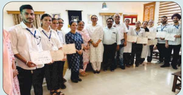
ਮਿਤੀ 1 ਜੂਨ 2024 ਨੂੰ ਮਾਡਲ ਬੁਥ-39 ਦੇ ਪੀ.ਓ., ਵਲੰਟੀਅਰ, ਕਾਲਜ ਪ੍ਰਿੰਸੀਪਲ ਅਤੇ ਫੈਕਲਟੀ ਮੈਂਬਰ