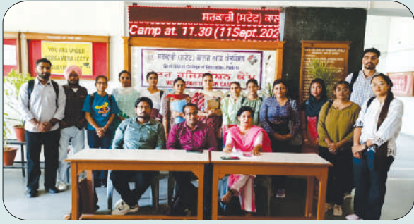
ਮਿਤੀ 11 ਸਤੰਬਰ 2023 ਨੂੰ ਵੋਟਰ ਐਨਰੋਲਮੈਂਟ ਸਵੀਪ ਅਧੀਨ ਲਗਾਏ ਇਕ ਰੋਜਾ ਕੈਂਪ ਵਿੱਚ ਵੋਟਾ ਬਣਵਾਉਂਦੇ ਹੋਏ ਵਿਦਿਆਰਥੀ