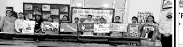
ਜਾਗਰੂਕਤਾ ਪ੍ਰੋਗਰਾਮ 'ਚ ਸ਼ਾਮਲ ਹੋਏ ਵਿਦਿਆਰਥੀ