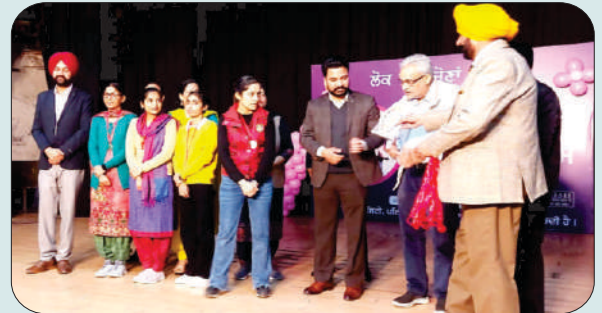
ਮਿਤੀ 3 ਦਸੰਬਰ 2023 ਨੂੰ ਰਾਜ ਪੱਧਰੀ ਸਨਮਾਨ ਸਮਾਰੋਹ ਦੌਰਾਨ ਕਾਲਜ ਦੇ ਵਿਦਿਆਰਥੀ ਇਨਾਮ ਪ੍ਰਾਪਤ ਕਰਦੇ ਹੋਏ