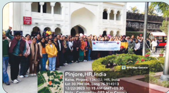
ਮਿਤੀ 22 ਦਸੰਬਰ 2023 ਨੂੰ ਕਰੀਅਰ ਕਾਉਂਸਲਿੰਗ ਸਕੀਮ ਤਹਿਤ ਪਿੰਜੋਰ ਗਾਰਡਨ ਦੇ ਵਿੱਦਿਅਕ ਟੂਰ ਤੇ ਵਿਦਿਆਰਥੀ ਅਤੇ ਸਕੀਮ ਇੰਚਾਰਜ