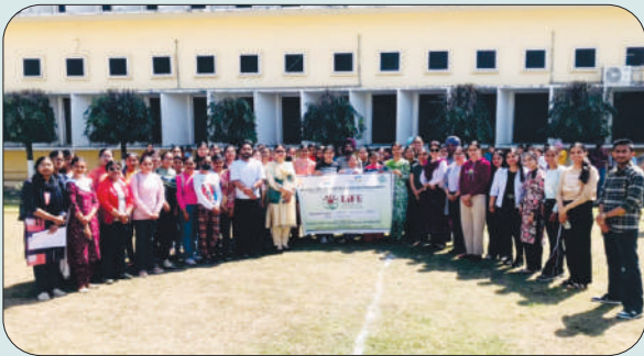
ਮਿਤੀ 18 ਮਾਰਚ 2024 ਨੂੰ 'ਹੈਲਥੀ ਲਾਈਫ ਸਟਾਈਲ' ਮੁਹਿੰਮ ਦੌਰਾਨ ਵਿਦਿਆਰਥੀ ਅਤੇ ਫੈਕਲਟੀ ਮੈਂਬਰ