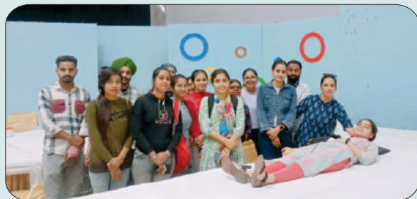
ਮਿਤੀ 19 ਅਕਤੂਬਰ 2023 ਨੂੰ ਪੰਜਾਬੀ ਯੂਨੀਵਰਸਿਟੀ, ਪਟਿਆਲਾ ਵਿਖੇ ਖੂਨਦਾਨ ਕਰਦੀ ਹੋਈ ਕਾਲਜ ਦੀ ਵਿਦਿਆਰਥਣ