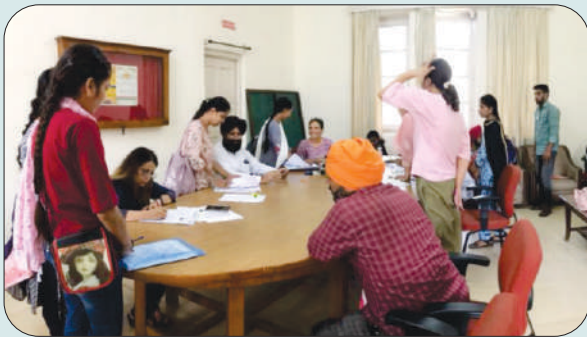
ਮਿਤੀ 24 ਅਗਸਤ 2023 ਨੂੰ ਬੀ.ਐਡ.-1 ਦੀ ਐਡਮਿਸ਼ਨ ਦੀ ਪਹਿਲੀ ਕਾਉਂਸਲਿੰਗ ਦੌਰਾਨ ਵਿਦਿਆਰਥੀਆਂ ਦੇ ਦਾਖਲਾ ਫ਼ਾਰਮ ਚੈਕ ਕਰਦੇ ਹੋਏ ਕਮੇਟੀ ਮੈਂਬਰ