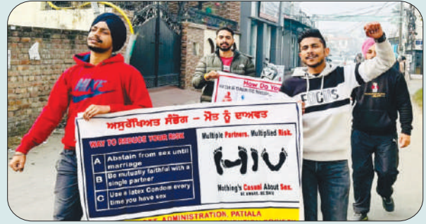
ਮਿਤੀ 24 ਦਸੰਬਰ 2023 ਨੂੰ ਏਡਸ ਜਾਗਰੂਕਤਾ ਰੈਲੀ ਕੱਢਦੇ ਹੋਏ ਵਲੰਟੀਅਰ