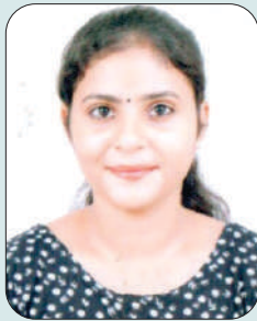
ਜੈਸਮੀਨ ਐਮ.ਐਡ. ਭਾਗ-1 ਕਾਲਜ ਕਲਰ ਸਾਹਿਤਕ