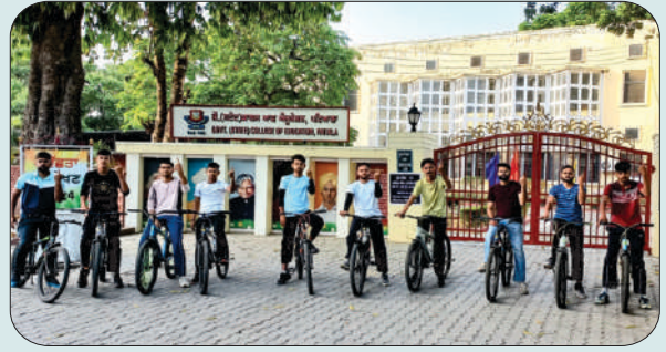
ਮਿਤੀ 27 ਅਕਤੂਬਰ 2023 ਨੂੰ ਜ਼ਿਲ੍ਹਾ ਪ੍ਰਸ਼ਾਸਨ ਵੱਲੋਂ ਕਰਵਾਈ 'ਵੋਟ ਮੇਰਾ ਅਧਿਕਾਰ' ਸਾਈਕਲ ਰੈਲੀ ਕਾਂਢਦੇ ਹੋਏ ਵਿਦਿਆਰਥੀ