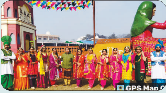
ਮਿਤੀ 26 ਜਨਵਰੀ 2024 ਗਣਤੰਤਰ ਦਿਵਸ ਦੇ ਮੌਕੇ ਤੇ ਜ਼ਿਲ੍ਹਾ ਪੱਧਰੀ ਪ੍ਰੋਗਰਾਮ ਵਿੱਚ ਗਿੱਧੇ ਦੀ ਪੇਸ਼ਕਾਰੀ ਕਰਨ ਵਾਲੀਆਂ ਵਿਦਿਆਰਥਣਾਂ ਅਤੇ ਇੰਚਾਰਜ