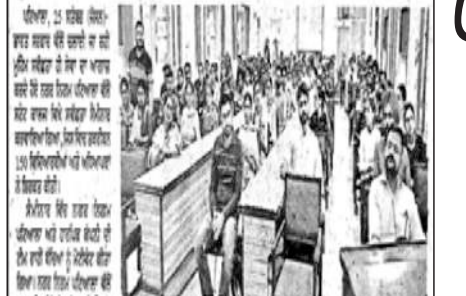
ਨਗਰ ਨਿਗਮ ਦੀ ਸਵੈ-ਸੇਵਾ ਸਮੇਂਗਰ ਦਾ ਉਦਘਾਟਨ।

ਪਟਿਆਲਾ, 15 ਜਨਵਰੀ (ਗੁਰਦਿੱਤ ਸਿੰਘ ਐੱਸ.ਐੱਸ.)—ਨਗਰ ਨਿਗਮ ਪਟਿਆਲਾ ਨੇ ਸਟੇਟ ਕਾਲਜ ਵਿਖੇ ਸਵੈ-ਸੇਵਾ ਸਮੇਂਗਰ ਦਾ ਉਦਘਾਟਨ ਕਰਵਾਇਆ। ਇਸ ਸਮੇਂਗਰ ਵਿਖੇ ਨਗਰ ਨਿਗਮ ਦੇ ਮੈਂਬਰਾਂ ਨੇ ਸਟੇਟ ਕਾਲਜ ਵਿਖੇ ਸਵੈ-ਸੇਵਾ ਸਮੇਂਗਰ ਦਾ ਉਦਘਾਟਨ ਕਰਵਾਇਆ।