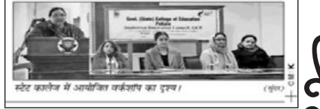
ਸਟੇਟ ਕਾਲੇਜ ਮੇਂ ਆਯੋਜਿਤ ਵਰਕਸ਼ਾਪ ਦਾ ਉਦਘਾਟਨ।

ਪਟਿਆਲਾ, 14 ਨਵੰਬਰ (ਗੁਰਦਿੱਤ ਸਿੰਘ ਐੱਸ.ਐੱਸ.)—ਗਵਰਨਮੈਂਟ ਕਾਲੇਜ ਆਫ਼ ਐਜੂਕੇਸ਼ਨ ਪਟਿਆਲਾ ਮੇਂ ਡਿਸਟ੍ਰਿਕਟ ਐਜੂਕੇਸ਼ਨਲ ਡਿਵੀਜ਼ਨ ਕੌਂਸਲ ਦਾ ਆਗਾਜ ਕਰਵਾਇਆ ਗਿਆ। ਇਸ ਆਗਾਜ ਵਿੱਚ ਵਿਦਿਆਰਥੀਆਂ ਨੂੰ ਸ਼ੈਖ਼ਣਿਕ ਪ੍ਰੋਗਰਾਮਾਂ ਦੀ ਮਹੱਤਤਾ ਬਾਰੇ ਸੂਚੀਤ ਕੀਤਾ ਗਿਆ।