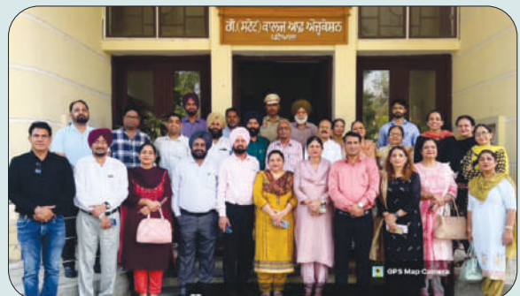
ਮਿਤੀ 21 ਅਕਤੂਬਰ 2023 ਨੂੰ ਓਲਡ ਸਟੂਡੈਂਟ ਐਸੋਸੀਏਸ਼ਨ ਦੀ ਮੀਟਿੰਗ ਵਿੱਚ ਸ਼ਾਮਿਲ ਪੁਰਾਣੇ ਵਿਦਿਆਰਥੀ