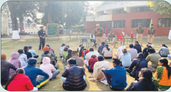
ਮਿਤੀ 27 ਦਸੰਬਰ 2023 ਨੂੰ ਅੱਗ ਬੁਝਾਊ ਵਿਭਾਗ ਦੇ ਅਫਸਰ ਐਨ.ਐਸ.ਐਸ. ਵਲੰਟੀਅਰ ਨੂੰ ਅੱਗ ਬੁਝਾਊ ਯੰਤਰਾਂ ਦੀ ਟ੍ਰੇਨਿੰਗ ਦਿੰਦੇ ਹੋਏ